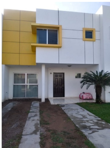
UBICACIÓN DEL INMUEBLE Ave. Bariloche 3000-38, Avellaneda Culiacán, Sinaloa